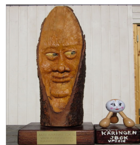
Gubbstrutten – donerad av Leif Eek Käringen – tillverkad av Mats Bodin

TACK alla som deltagit under 2017 och vi hälsar alla välkomna åter 2018!