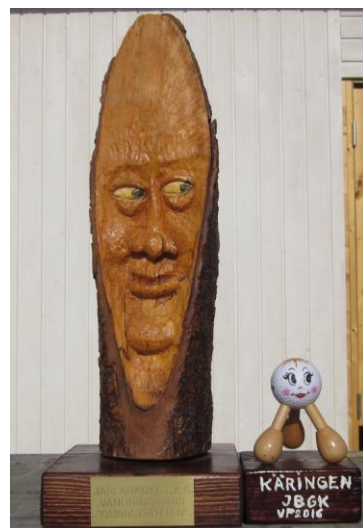
Vandringspriset Gubbstrutten Donerad av Leif Eek 2015

SSO Skogberga Senior Open Spelas på tisdagar, kl 9.30. Samling 9.15 på parkeringen. Ingen föranmälan till Skogberga. Ca 22 deltävlingar på Skogberga och spel på annan bana. Varje deltävling: 1:an=5 p. 2:an=4 p. 3:an=3p. 4:an= 2 p. Övriga får 1 poäng var. De 8 bästa rundorna räknas. Max 40 p. Den med lägre handicap vinner. Vill du få Senior-utskick via mail? Skriv då till evali.lindgren (at) telia.com. Vi träffas även på Ullna Indoor på tisdag förmiddagar. Start 15 nov. Bara för trevlighetens skull. Ingen anmälan.